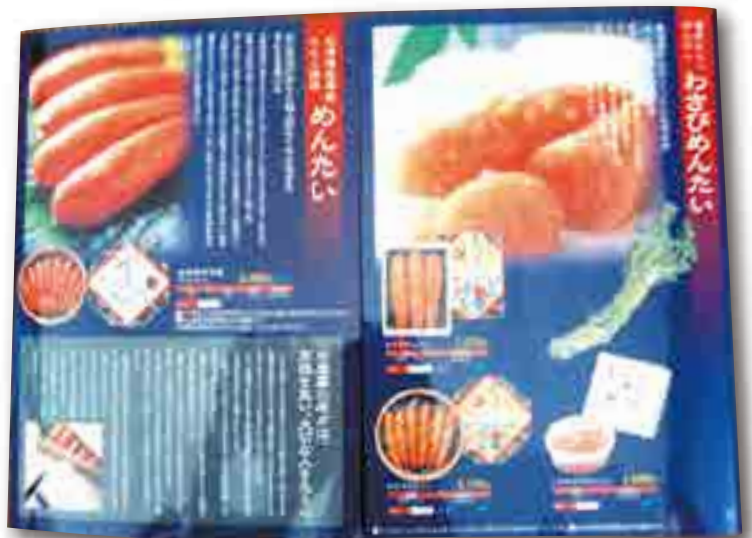
▲鳴海屋 商品カタログ