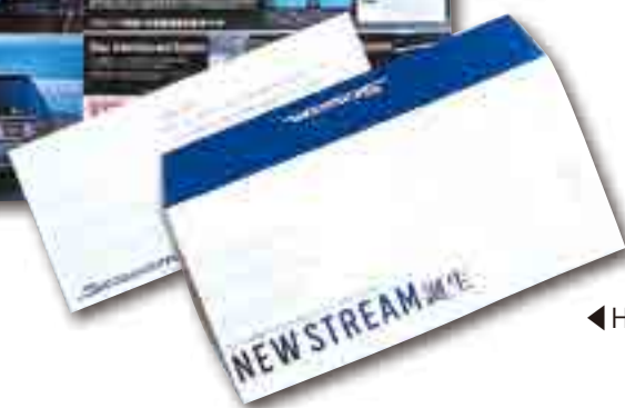
◀ Honda DM 類