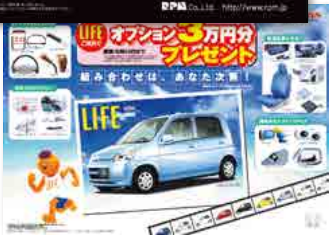
◀ Honda キャンペーンポスター