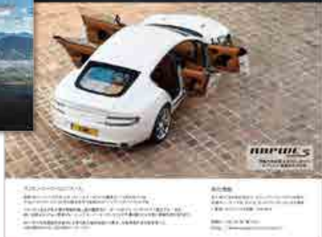
▲ ASTON MARTIN DM 類