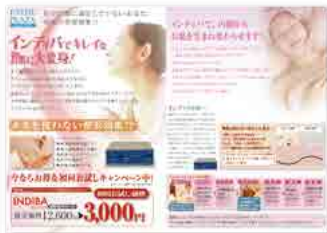
▲エステブラザ ポスター