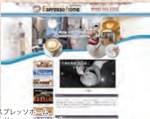
エスプレッソホーム http://espressohome.jp/